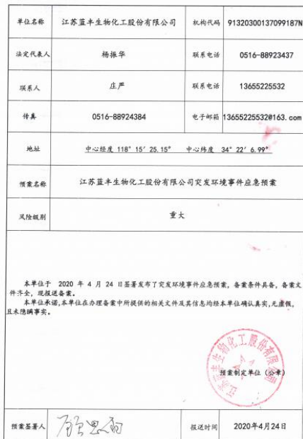
企业事业单位突发环境事件应急预案备案表